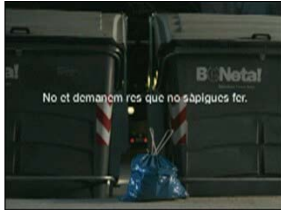
Fotogrames de l'anunci que s'emetrà per a la campanya de neteja amb el lema "No et demanem res que no sàpigués fer"