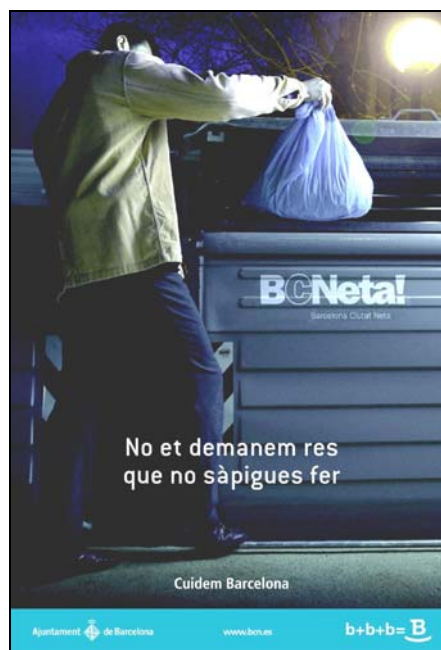
Imatge gràfica de la banderola que es veurà pels carrers

Actuacions a favor d'activitats que estimulin uns comportaments més cívics en l'àmbit de la mobilitat dels ciutadans.