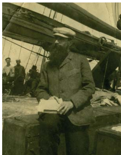
Maillol al vaixell d'anada a Grècia.

In addition to an emblematic and thought-provoking collection of all the artistic and documentary material related to the trip to Greece - Maillol's diary and notebook of drawings, Kessler's photographs, a couple of oil paintings, etc. -, the bulk of the exhibition features a painstaking selection of 23 sculptures that traces the evolution of his entire career, as well as monumental sculpture, Mediterranean (1905), his most famous work and one of the most influential sculptures of the 20 th century. Finally, in the adjoining room, you can see the short film of the interview that the filmmaker Jean Lods conducted with Maillol, in his studio in Banyuls, a year before his death.