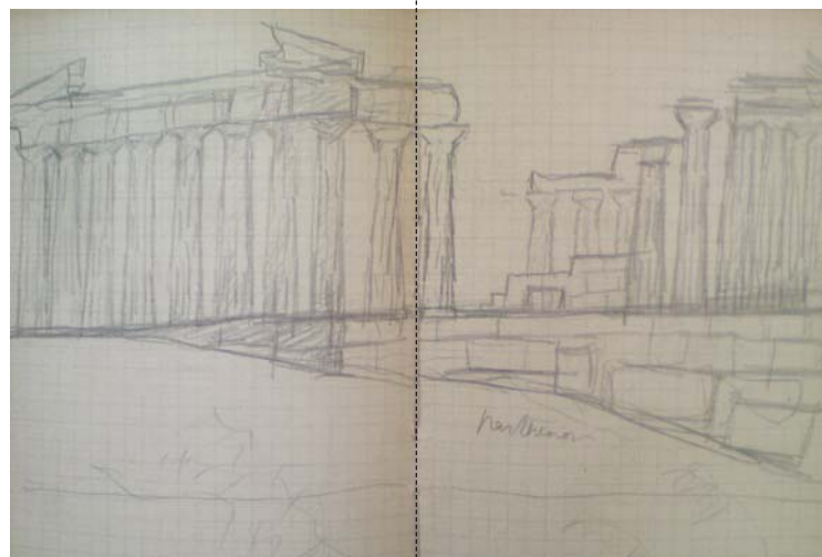
Partenó a l'Acropolis. Quadern de dibuixos de Maillol, 1908.