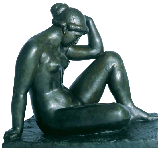
Maillol, Mediterrània , 1905 Col·lecció particular.

Outre un échantillon représentatif et suggestif de tout le matériel artistique et documentaire lié au voyage en Grèce (le journal et le carnet des dessins de Maillol, les photos de Kessler, deux huiles...), l'exposition accueille une sélection soignée de vingt-trois sculptures qui nous permettent de suivre l'évolution de sa trajectoire, ainsi que la statue monumentale Méditerranée (1905), son œuvre la plus célèbre et l'une des sculptures les plus décisives du XXe siècle. Dans la salle attenante, on peut également voir le court-métrage de Jean Lods, incluant l'entretien que le cinéaste français fit à Maillol dans son atelier de Banyuls-sur-Mer, un an avant la mort du sculpteur.