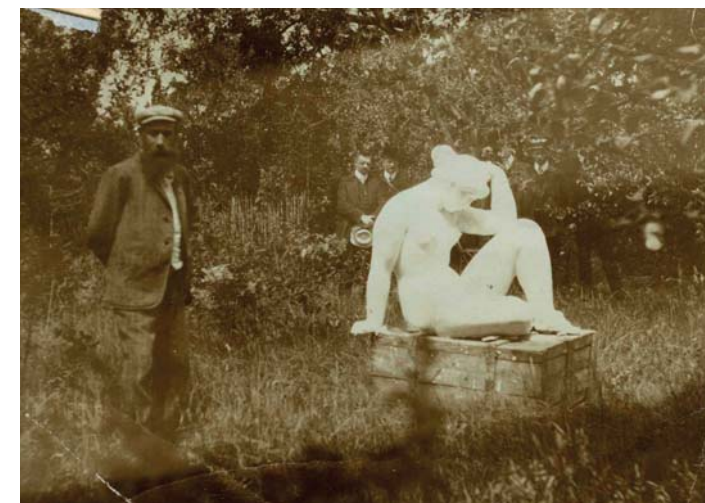
Maillol i la Mediterrània al jardí de Marly-le-Roi.