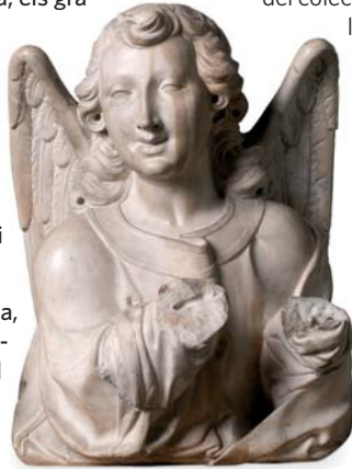
Bust d'àngel Antic retaule major de Santa Maria del Mar de Barcelona, 1632

Una mirada al 1700. A partir de los grabados de la colección Gelonch Viladegut es una exposición presentada desde una perspectiva particular y a la vez complementaria de las grandes muestras expositivas históricas incluidas en la amplia programación de exposiciones y actividades de conmemoración del tricentenari de los hechos de 1714.