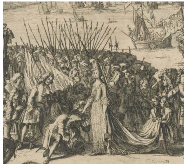
Arribada de la reina Elisabet Cristina a Mataró Aiguafort, 1720