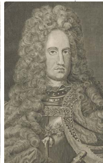
Carles III Aiguafort, primer terç del segle XVIII