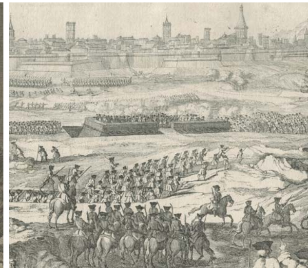
Setge de Barcelona de 1714 Aiguafort, cap al 1750