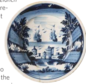
Plata Barcelona, primer terç del segle XVIII

This is the exhibition of a collector, within the museum of a great collector, Frederic Marès, an inevitable referent in the world of collecting in Barcelona, Catalonia and Europe.