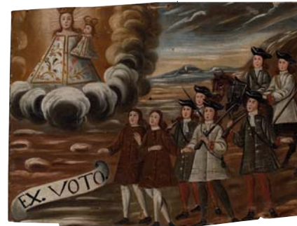
Exvot Catalunya, 1705-1714 (?)