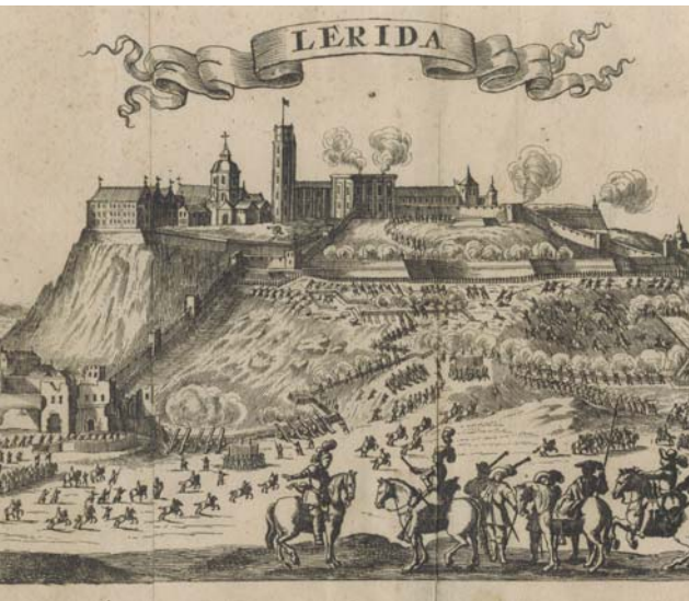
Vista de Lleida Aiguafort, cap al 1717