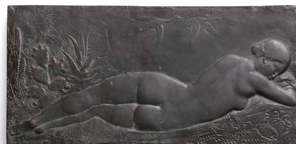
Dona ajaguda d'esquena , entre 1930 i 1936. Museu Frederic Marès.