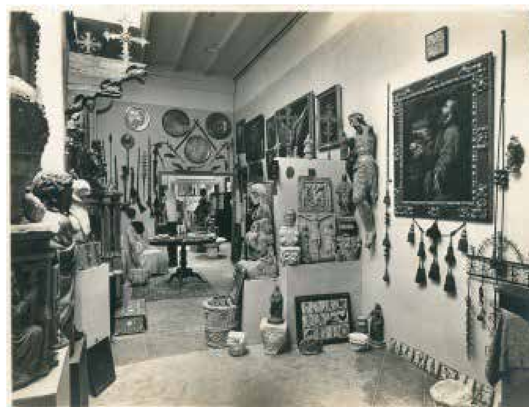
Taller de Frederic Marès al carrer Mallorca, 1944. Al fons es pot distingir el paravent.