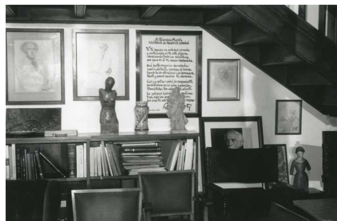
Estudi-biblioteca de Frederic Marès, entre 1998 i 1999. Recolzat sobre el moble es pot veure el relleu Dona ajaguda d'esquena .

Aquesta caixa d'estètica Art Decó està decorada amb baix relleu frontal emmarcat amb cinquanta-quatre requadres encolats i amb ornamentació gravada. Els laterals presenten una distribució semblant a la davantera amb unes nanses en forma de petxina. La caixa formava part de la decoració del domicili de l'escultor fins al 2010, quan fou adquirida pel Museu al seu hereu. El relleu central presenta una dona nua ajaguda d'esquena, amb palmera i cactus als peus i un vaixell al fons que respon amb petites variacions al relleu Dona ajaguda d'esquena del qual se'n conserven tres exemplars en bronze, un al mateix Museu.