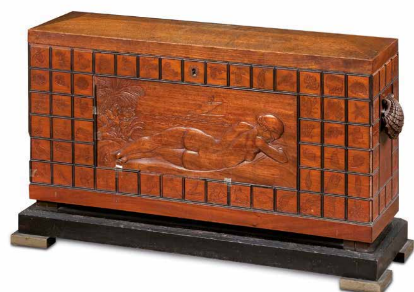
Caixa, dècada de 1930. Museu Frederic Marès.

Amb motiu de la presentació del CATÀLEG DEL MOBLE . Fons del Museu Frederic Marès/6 (format digital), us oferim aquesta mostra gràfica i documental sobre els mobles dissenyats per Frederic Marès. L'escultor va realitzar una producció petita de mobiliari entre els quals destaquen dues peces de moble domèstic: un paravent i una caixa, conservats al Museu i que podem veure exposats a l'Estudi-biblioteca. Si voleu veure més mobiliari us podeu adreçar a la sala 15 de la planta 1 del Museu i a l'Aparador del Pati.