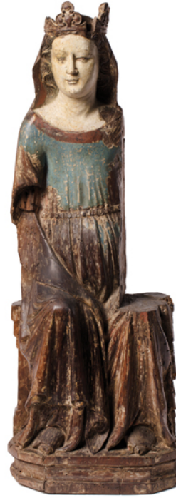
Mare de Déu Taller de Jaume Cascalls Catalunya. Segon quart del segle XIV Talla de fusta amb restes de policromia Procedència desconeguda Museu Frederic Marès (MFM 952)

Així mateix, l'exposició presta una atenció especial a l'estreta relació de Junyent amb el polític i col·leccionista Francesc Cambó, del qual va arribar a ser un dels principals assessors artístics quan va crear la seva extraordinària col·lecció de pintura europea. Una selecció d'aquarel·les i fotografies fetes per Junyent esdevé el millor testimoni de l'amistat entre tots dos i dels nombrosos viatges efectuats a bord del Catalònia : 10 aquarel·les originals i 1 pantalla amb aquarel·les i fotografies fetes per Junyent (durada 6 min.).