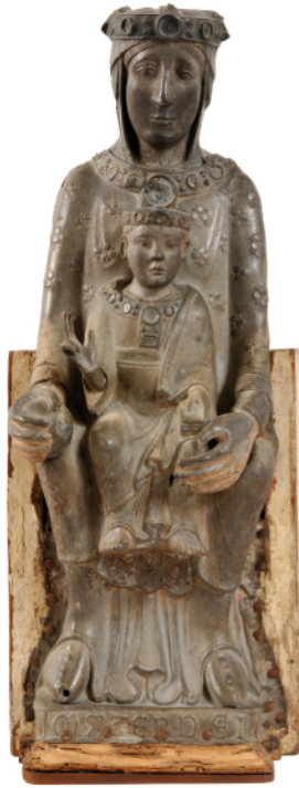
Mare de Déu amb el Nen Catalunya (?), França (?). Final del segle XII - inici del segle XIII Fusta amb recobriment de làmines de metall i restes de policromia Església de Santa Maria de Plandogau d'Oliola (Lleida) Museu Frederic Marès (MFM 655)