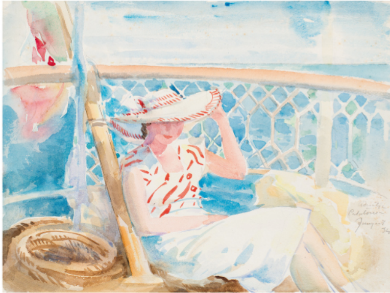
Noia amb pamelà a la coberta del Catalònia , Adriàtic, 1934