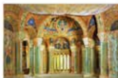
Escenografia per al Gran Teatre del Liceu de Barcelona del primer i tercer actes de l'òpera Parsifal, de Richard Wagner, 1913.