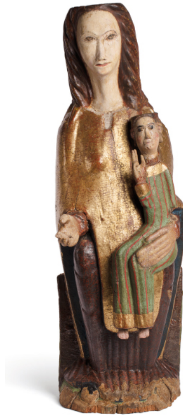
Mare de Déu amb el Nen Catalunya. Segle XIII Talla de fusta policromada Procedència desconeguda Museu Frederic Marès (MFM 657)