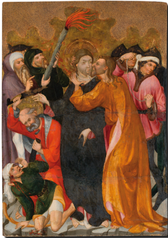
Prendiment de Jesús. Compartiment de retaule Lluís Borrassà. Primer quart del segle XV Trep sobre taula Col·lecció Junyent