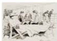
Dibuix de la volta al món, entre Marsella i Port Said, 1908.