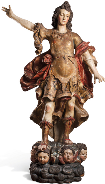
Sant Miquel Arcàngel Atribuït a Luisa Roldán, la Roldana . Segle XVII Talla de fusta policromada Col·lecció Junyent