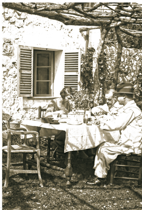
Francesc Cambó i Oleguer Junyent a Lluçalcari (Mallorca).

De ben segur que les exposicions que oferim des del Museu Frederic Marès i l'Arxiu Fotogràfic de Barcelona, Oleguer Junyent, fotògraf. Roda el món i torna al Born , aportaran llum sobre aquest personatge polifacètic que il·lustra tant el col·leccionisme artístic com la pràctica fotogràfica d'una època fonamental de la cultura del nostre país.