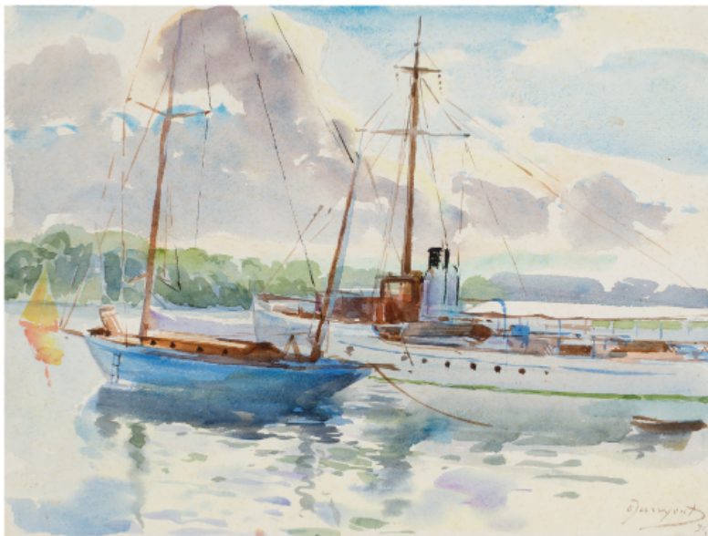
El "yatch" Catalònia , 1934