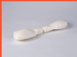
2 Matilde Grau Pòlvora infinita