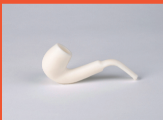
5 Mercè Casanovas Monsieur Magritte, c'est une pipe ça?