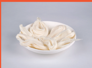
9 Joaquim Cantalozella Constel·lació de llagues