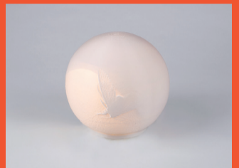
4 Cristina Pastó La llum i la papallona