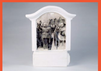
8 Fco. Javier Lozano Vilardell Angelus novus