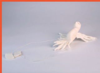
3 Tònia Coll Siguem sentimentals amb les aus, els humans vam tenir ales