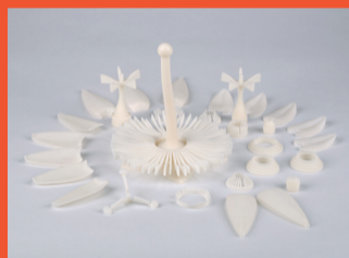
6 Àngels Viladomiu Passiflora